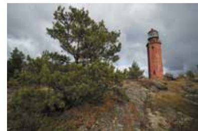
Маяк Большой Тютерс на одноименном острове в Финском заливе.

В Москве в Саду Эрмитаж открылась выставка «Маяки России», организованная Русским географическим обществом. Экспозиция состоит из фотографий маяков Херсонеса, Балтийска, Кронштадта, островов Гогланд, Тютерс, Род-