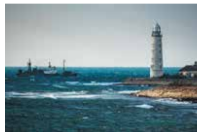
Маяк Херсонесский на мысе Херсонес, юго-западной оконечности Крымского полуострова.